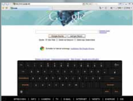
Internet / eMail