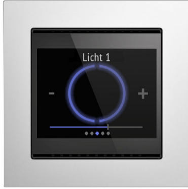
Abbildung mit Rahmen (nicht im Lieferumfang enthalten)

Artikelnummern Cala Touch KNX T: 70800 (Reinweiß RAL 9010) 70802 (Tiefschwarz RAL 9005) Cala Touch KNX TH: 70810 (Reinweiß RAL 9010) 70812 (Tiefschwarz RAL 9005) Cala Touch KNX AQS/TH: 70820 (Reinweiß RAL 9010) 70822 (Tiefschwarz RAL 9005)