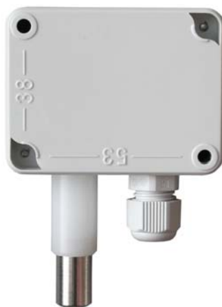
Abb. 2 Rückansicht mit Bemaßung der Öffnungen für die Befestigung