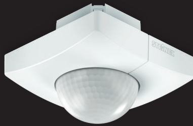
IS 3360 MX Highbay