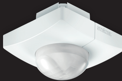
IS 345 MX Highbay