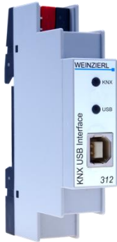
KNX USB Interface 312