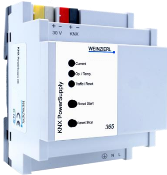
KNX PowerSupply 365