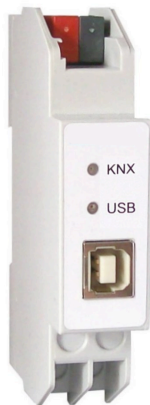
Figure 1: Photo of device

This interface is for establish a bidirectional connection between a PC and the KNX installation bus. The USB connector has a galvanic separation from the KNX bus. Both ETS (Engineering Tool Software) versions ETS3 or later and some Visualization tools support this interface.