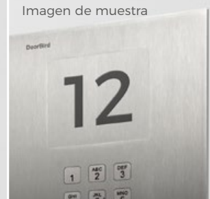
Placa de acero inoxidable grabable incluida en la entrega.