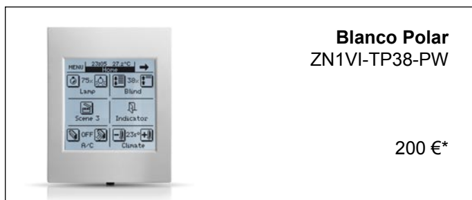
Blanco Polar ZN1VI-TP38-PW