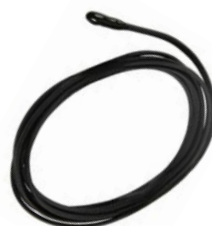
ZN1AC-NTC68E (Epoxi): 10 €*