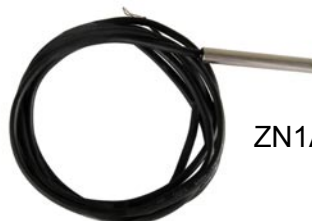
ZN1AC-NTC68S (acero): 12 €*