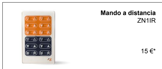
Mando a distancia ZN1IR